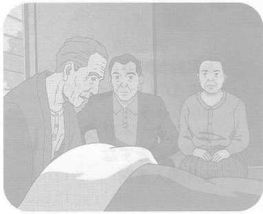
「トマトづくりだけはしたいんだが・・・」