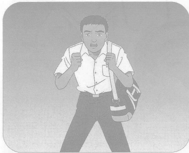
「どうしてぼくは外人なの。外人で何なの」