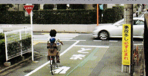
「自転車は一時停止を守るか?」定点観測