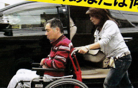
交通事故に合い、障害を負ってしまった方への取材