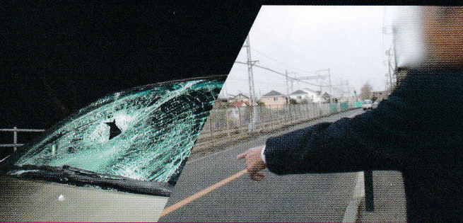
「こうすれば事故は防げた」事故体験者が語る