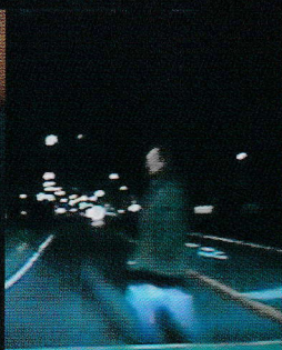
ドライブレコーダーが記録した事故発生の瞬間