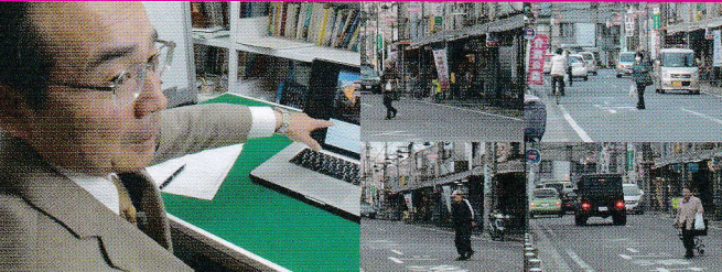
交通事故の専門家からのアドバイス