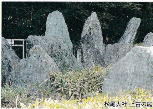
松尾大社 上古の庭