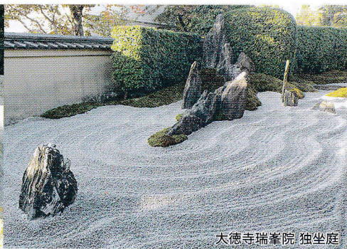
大徳寺瑞峯院 独坐庭