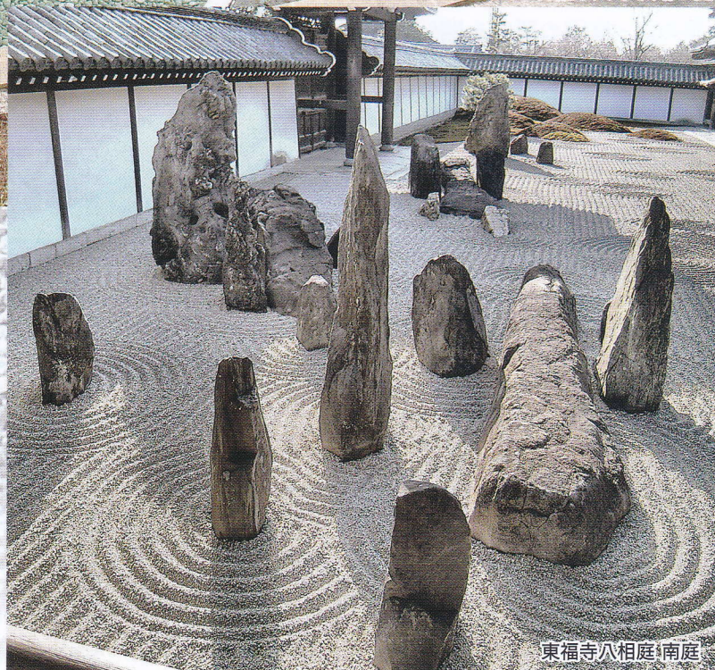
東福寺八相庭(南庭)