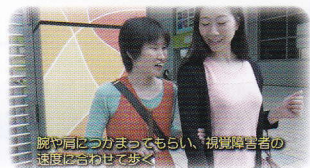
腕や肩につかまってもらい、視覚障害者の速度は合わせて歩く