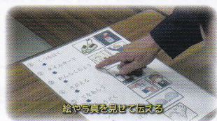
絵や写真を見せて伝える