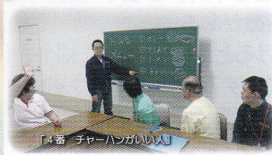
「4番 チャーハンがいい人」