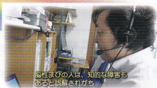
器音まひの人は、知的な障害もあると誤解されがち