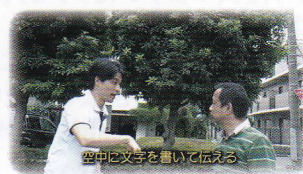
空中に文字を書いて伝える