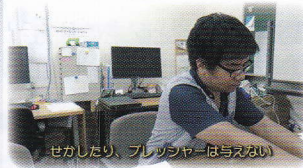
セカしたり、プレッシャーは与えない