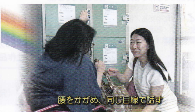
腰をかがめ、同じ目線で話す