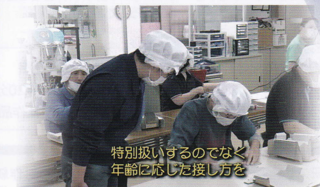
特別扱いするのでなく 年齢に応じた接し方を